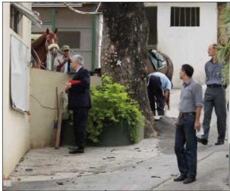
Une visite à une écurie a aussi eu lieu en ce vendredi matin