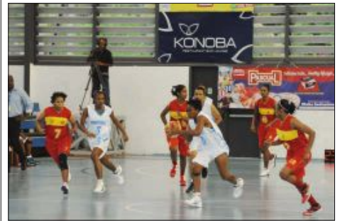
L'USBBRH (en rouge, dimanche) ira défier les joueuses de Mont Fleuri pour la deuxième fois avec, à la clé, le titre de championne de la CCCOI

L'Union sportive de Beau-Bassin/Rose-Hill (USBBRH) a remporté, hier soir, la rencontre qui l'opposait aux Seychelloises d'Anse Étoile Stars et se qualifie donc pour la première finale de son histoire. De son côté, le Real, vice-champion en titre, doit battre St Pierre pour espérer terminer troisième.